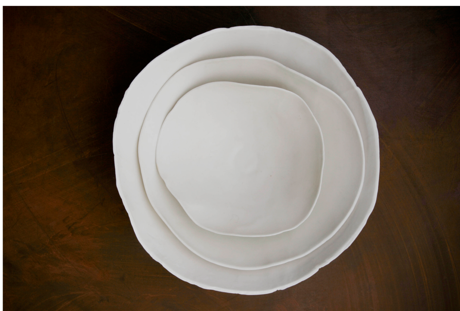
Coupelles et saladiers en porcelaine estampés. H: 6 cm/D: 18 cm; H: 6,5 cm/D: 22 cm; H: 11 cm/D: 26,5 cm.