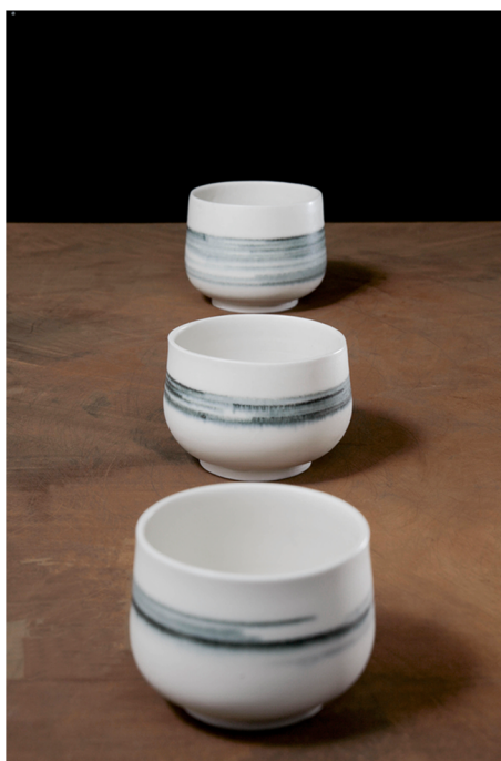
Bols en porcelaine tournées, décor: oxydes métalliques. H: de 5 à 8 cm /D: de 6 à 8 cm.