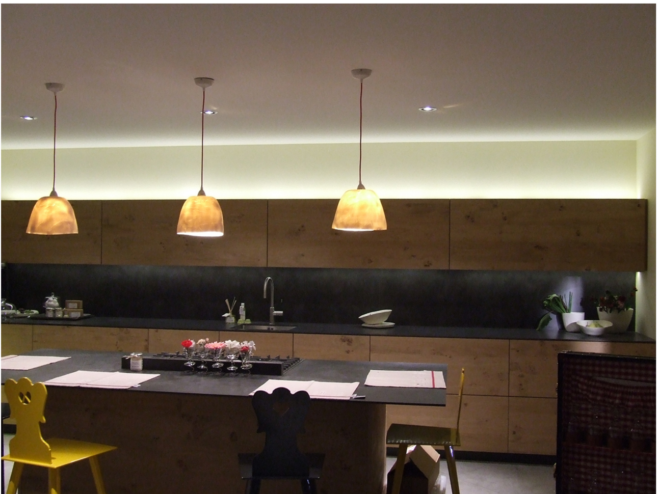
"La Maison de Caroline", salon MaisonDéco de Colmar,, novembre 2013

Abat-jour en porcelaine estampée. H: 18 cm / D: 25cm.