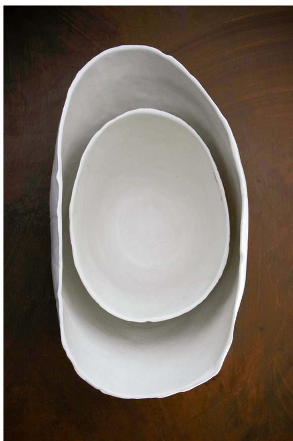
Contenants en porcelaine estampés. H: 14 cm /D: 18 cm et H: 18 cm /D: 25cm.