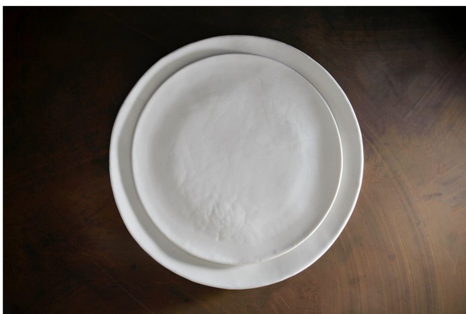
Assiettes et sous-assiettes en porcelaine estampées. Diamètre: 27 cm et 32 cm.