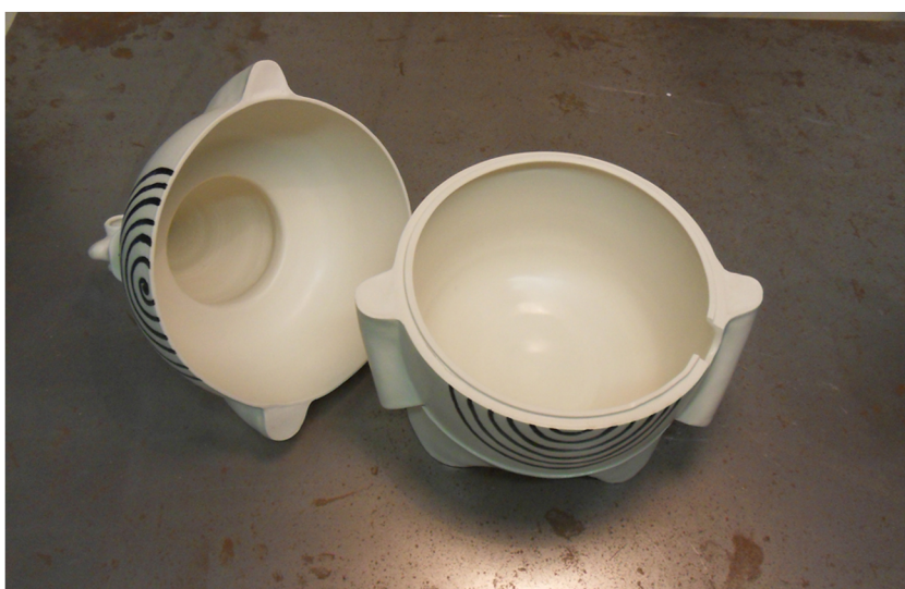
Le Père Ubu, soupière 2011.

Dimensions: H: 32 cm, D: 24 cm, contenance: 2L.